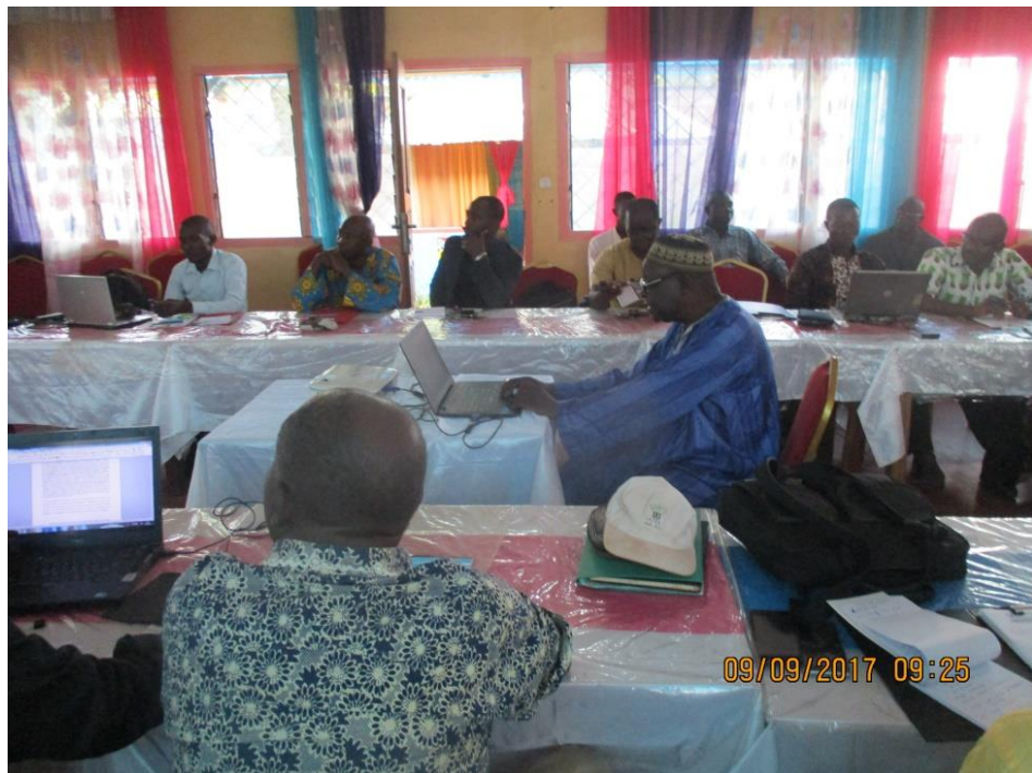
Présentation du Rapport d'activités du FN de la CEFDHAC RCA