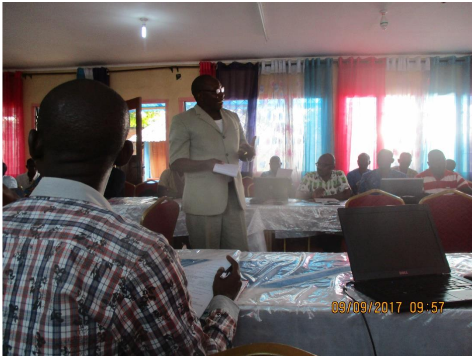
Présentation des statuts et Règlement Intérieur du FN de la CEFDHAC RCA