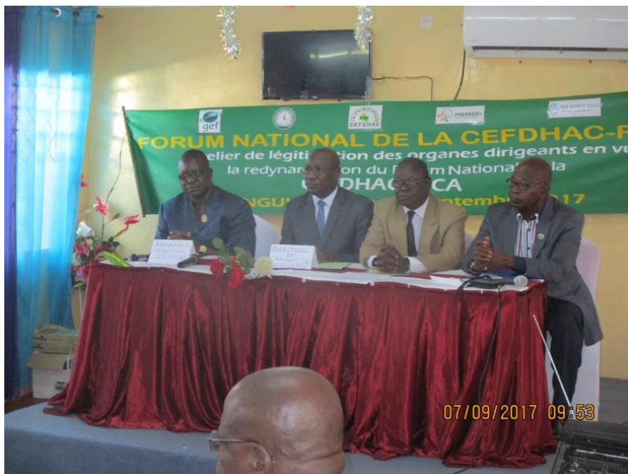
1. Mise en place pour la cérémonie d'ouverture de l'atelier