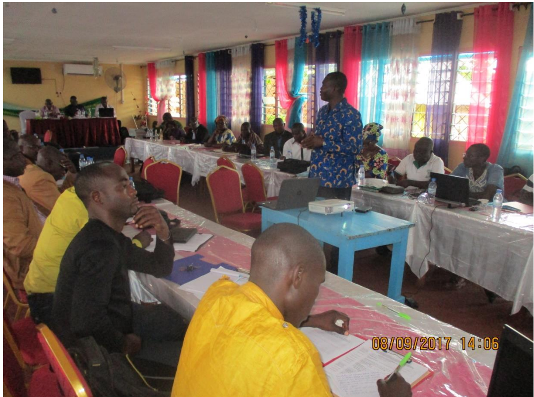
Présentation du Fonds Vert Climat