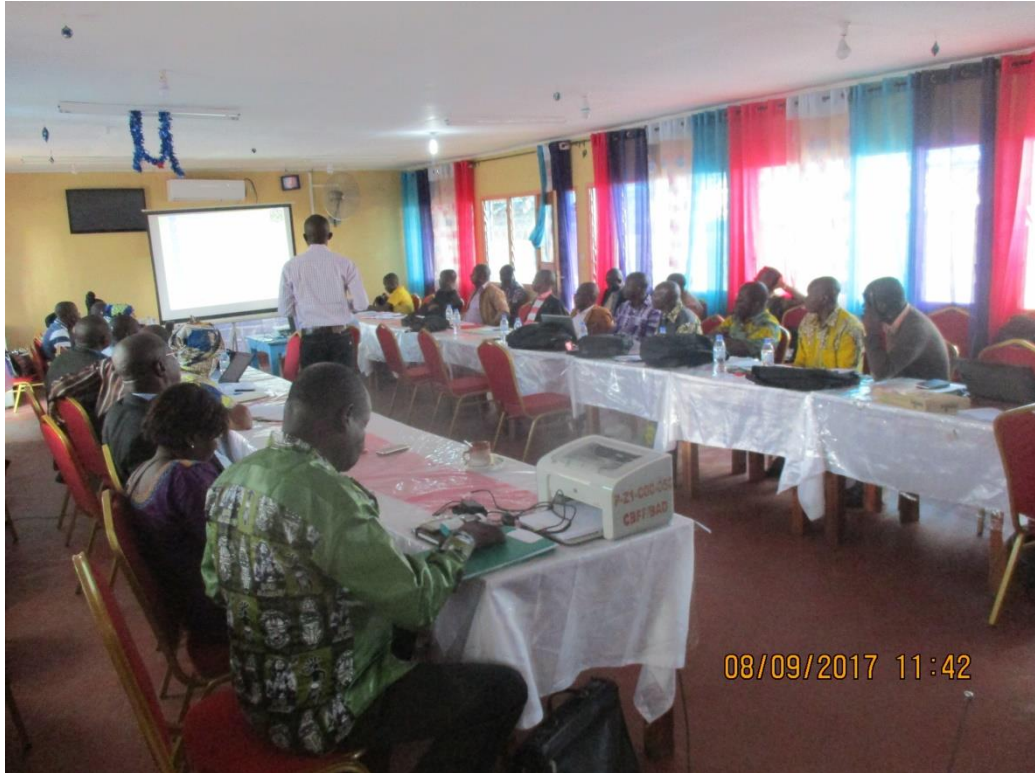
Les enjeux de la CoP21