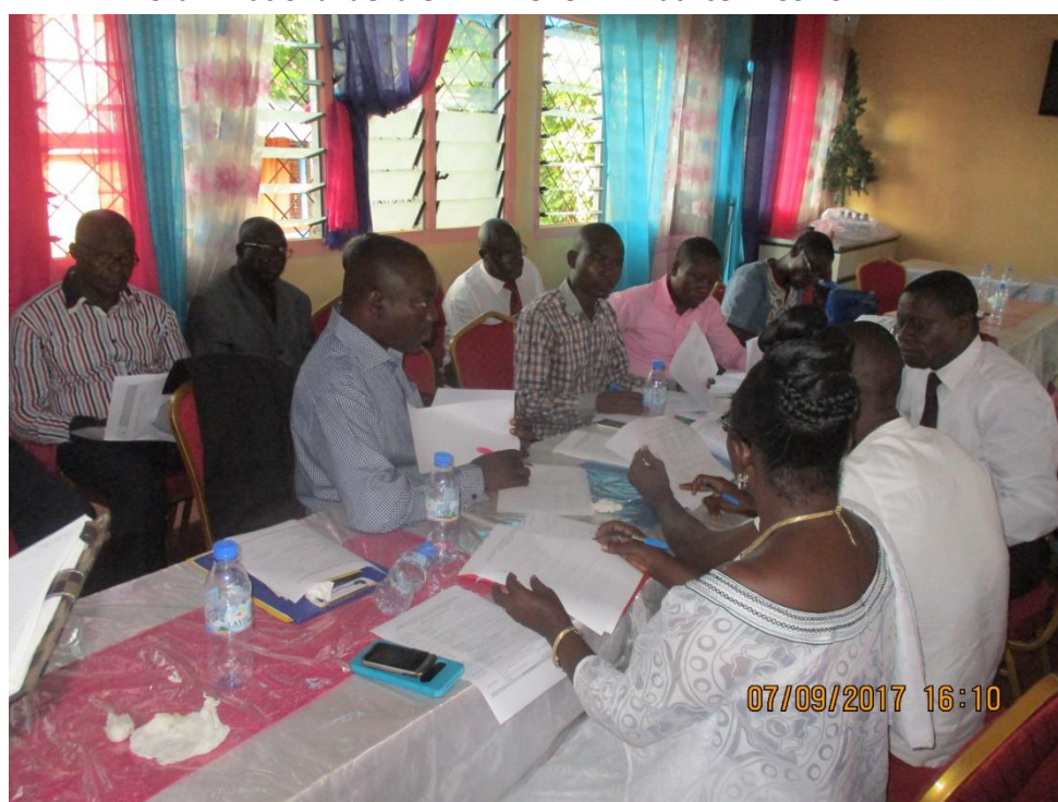
5. Examen de la Feuille de route du Forum National de la CEFDHAC en vue de son adoption par les participants