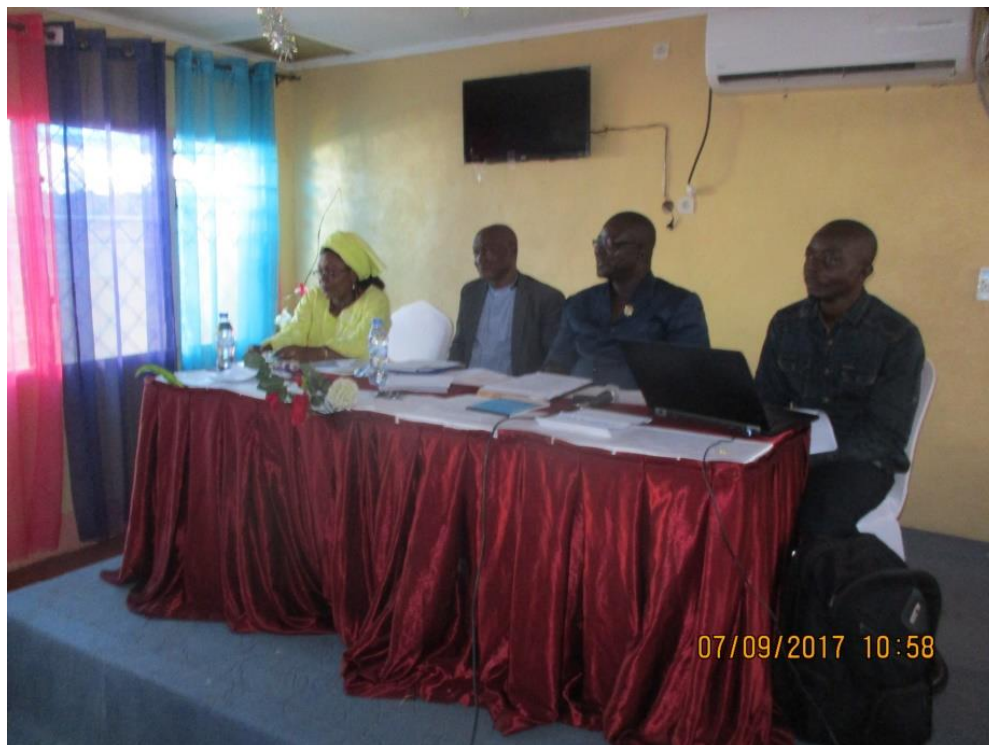
3. Mise en place du Bureau de l'atelier