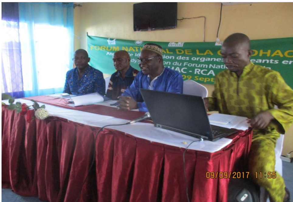
2. Adresse du Président entrant du FN CEFDHAC RCA après son élection à la tête du FN Pour ses mots de remerciements et les tâches qui attendent la nouvelle équipe dirigeante et les grands défis à relever.