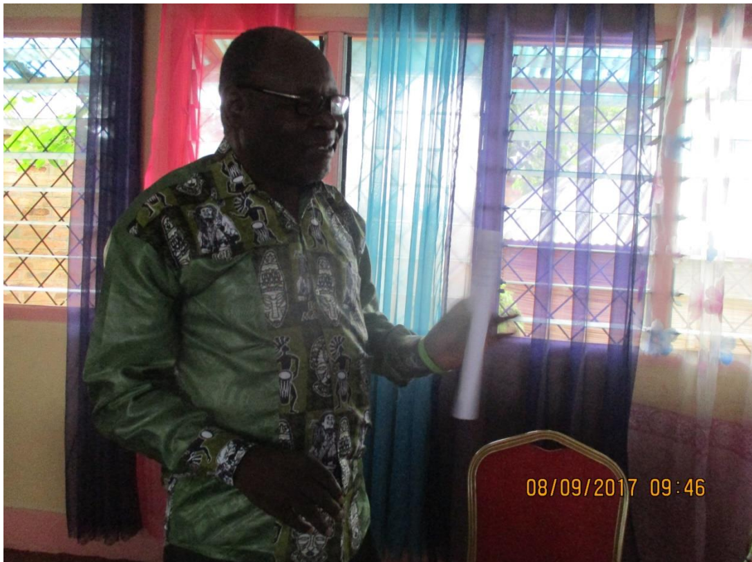
Animation et modération de l'atelier par le Président du FN de la CEFDHAC RCA