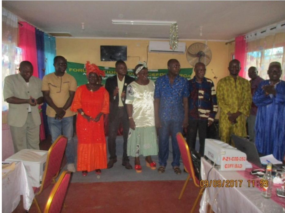
1. Nouvelle équipe dirigeante du Forum National de la CEFDHAC RCA