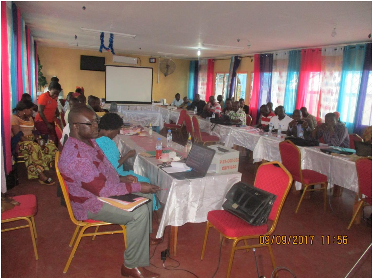
3. Vue des participants à l'atelier le 09/09/17 après les élections des membres du nouveau bureau du FN de la CEFDHAC RCA