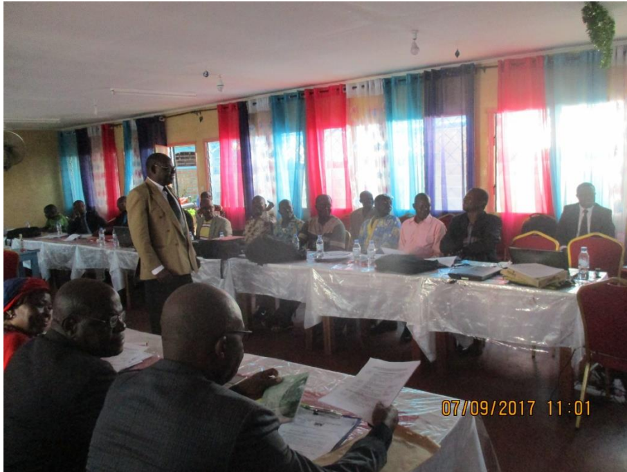
Une vue des participants à l'atelier de légitimation du FN CEFDHAC RCA