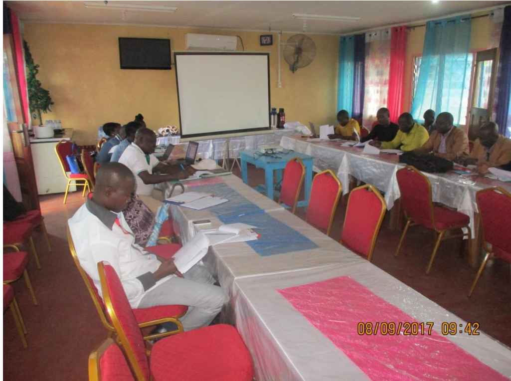
Journée du 08/09/17 Suite des travaux