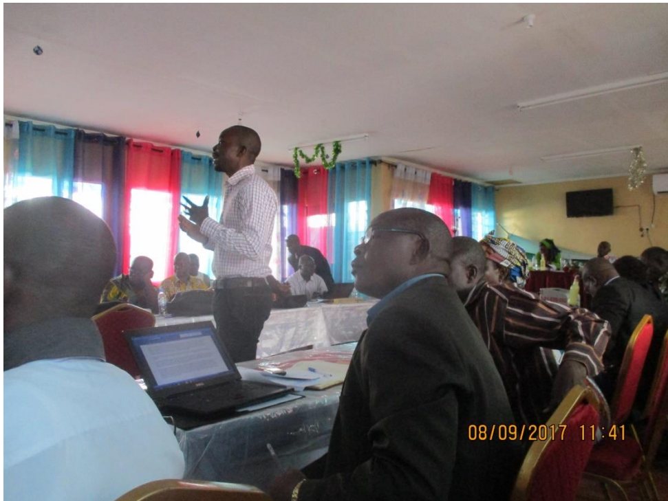
Présentation des communications lors de l'atelier